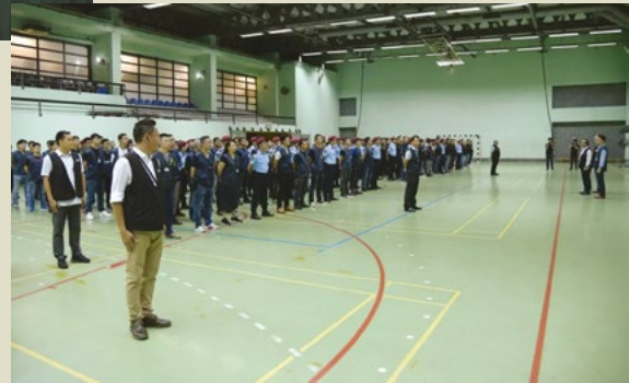
“雷霆18”聯合行動警察總局數據統計

“雷霆行動”是粵港澳三地警方自港澳回歸以來聯合執行的打黑行動，旨在攜手打擊各類型的跨境犯罪，震懾犯罪份子。“雷霆18”在2018年5月15日至8月15日展開，為加強堵截、打擊偷渡等涉海不法行為，